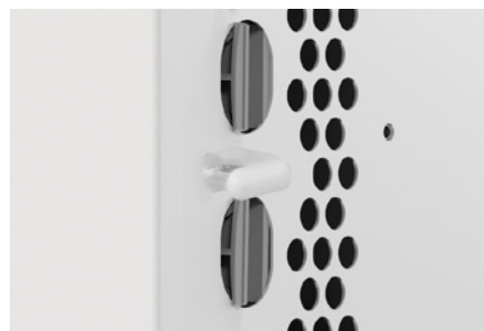
Czujnik temperatury pokojowej