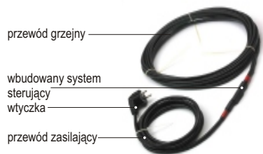
Przewód grzejny TS Thermo Switch

Przewód grzejny TS jest przeznaczony do systemów przeciwbłodzeniowych chroniących: instalacje rurowe, kryzy, zawory itp... Moc jednostkowa: 17 W/mb . Zasilanie jednostronne ( wbudowana wtyczka ) Długość przewodów zasilających: 3 mb.