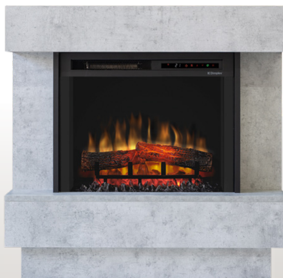
Avalone concrete 111167 / 5011139123824