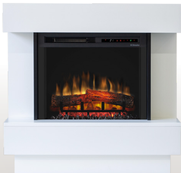
Avalone white 111168 / 5011139123800